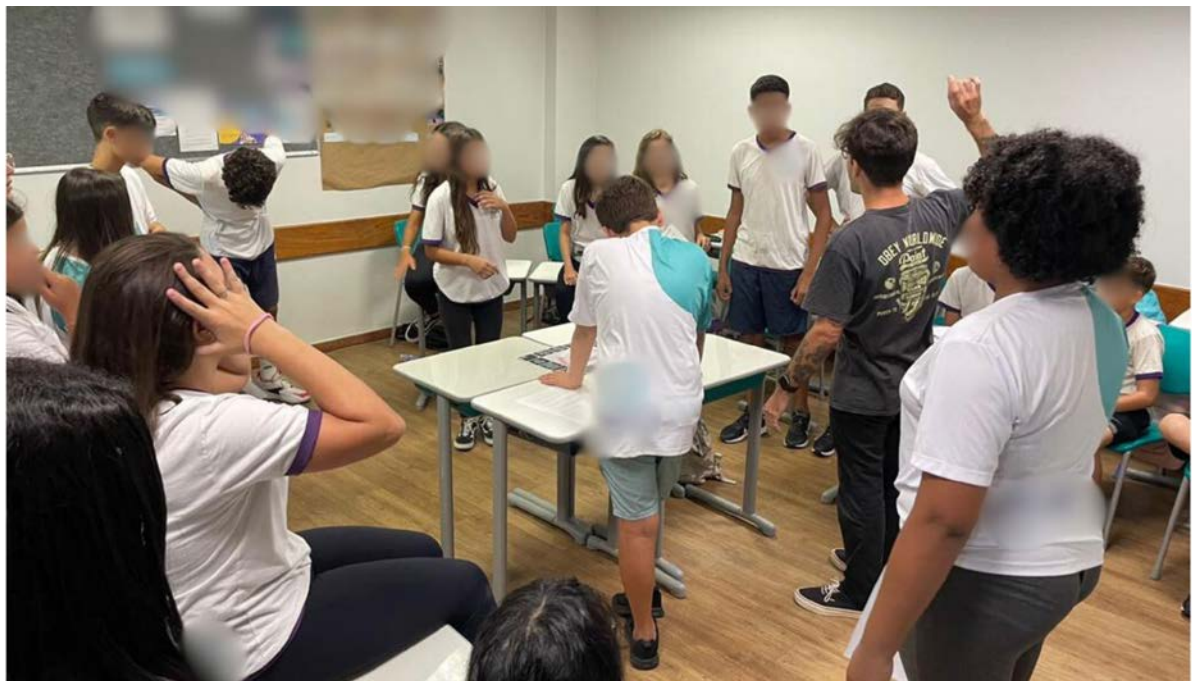
Turma do oitavo ano