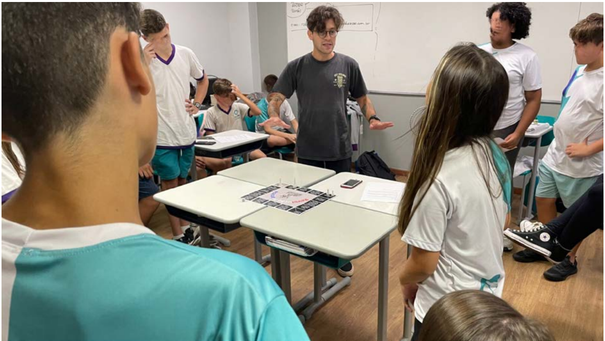
Turma do oitavo ano