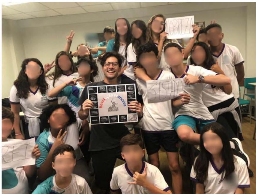
Turma do oitavo ano